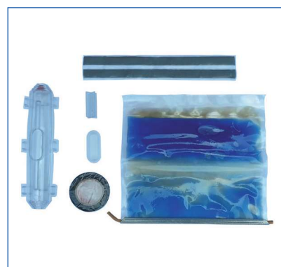
Giunzioni cavi affogate in resina