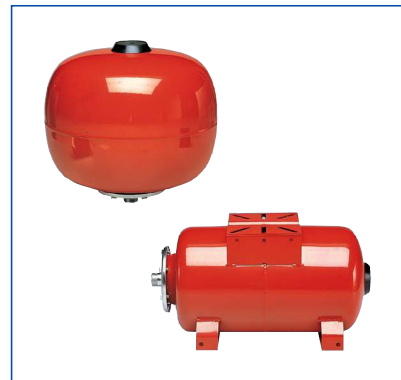
Vasi verticali ed orizzontali da 24L a 500L

Vertical and horizontal pressure tanks from 24 to 500 litres