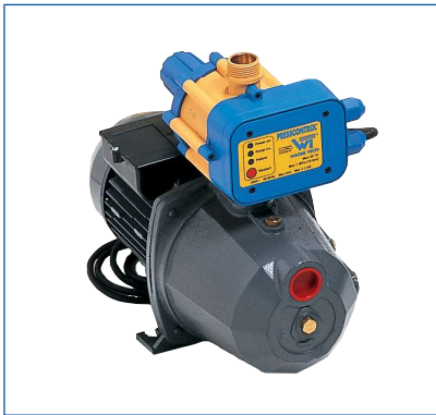
Autoclavi con PRESSCONTROL