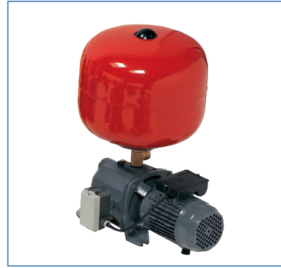
Autoclavi con vaso sferico