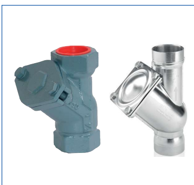
Valvole di non ritorno a palla per acque cariche