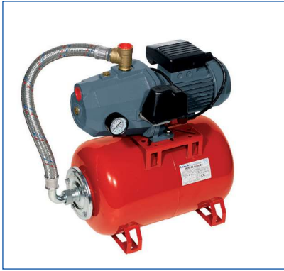
Autoclavi con vaso orizzontale